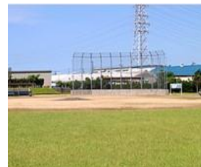
大沢野グラウンド